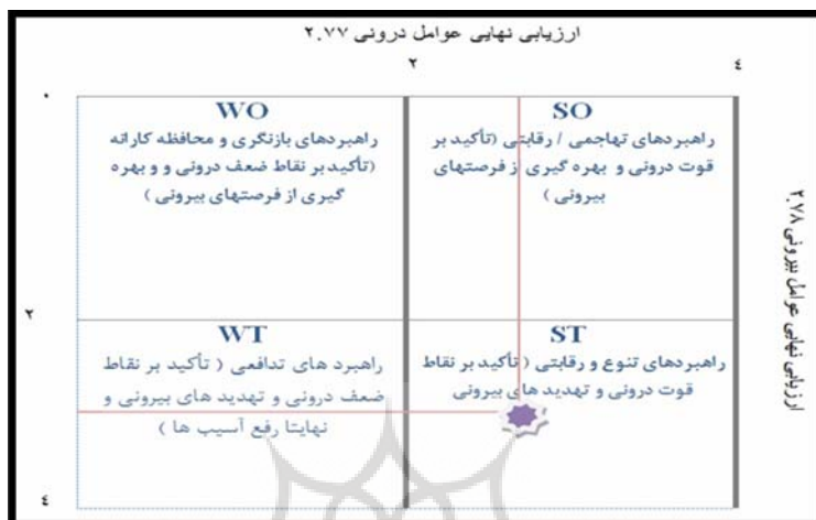
شکل (۲) ماتریس نمره نهایی ارزیابی عوامل داخلی و خارجی