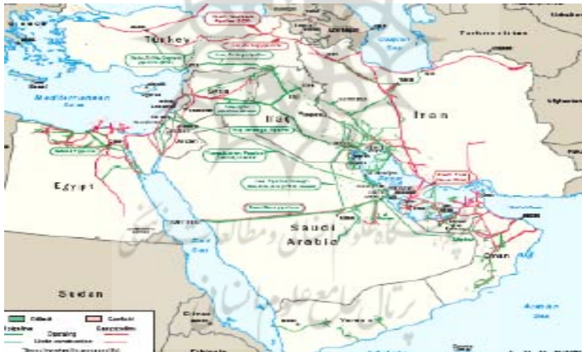
شکل (۲) نقشه خطوط لوله نفت و گاز در خلیج فارس

یکی از مناسب ترین و اقتصادی ترین روش های انتقال گاز طبیعی در حال حاضر، انتقال بوسیله خط لوله می باشد که هم اکنون قسمت اعظم انتقال گاز جهان از این طریق صورت می گیرد. بطوری که در پایان سال ۲۰۱۰ از مجموع ۹۷۵/۲۲ میلیارد متر مکعب گاز مبادله شده، ۶۷۹/۵۹ میلیارد متر مکعب آن از طریق خط لوله بوده است (Bp Statistical Review of World Energy, ۲۰۱۱: ۲۸). در منطقه خلیج فارس نیز هرچند که هم اکنون خطوط لوله گازی بین مرزی، به ندرت وجود دارد اما قراردادهای عمده ای بین کشورهای منطقه جهت انتقال گاز از طریق خط لوله بسته شده است که بعضی از آنها اجرایی شده اند. (شکل ۲)