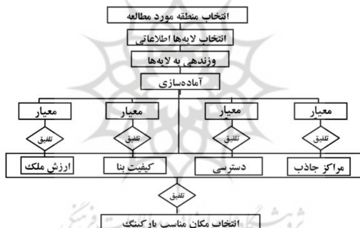
شکل (۱) مراحل مکان‌یابی پارکینگ با استفاده از GIS (قاضی عسگر نایینی، ۱۳۸۳)

به منظور مکان‌یابی پارکینگ در GIS ابتدا می‌بایست منطقه مورد مطالعه و سپس پارامترهای موثر در مکان‌یابی پارکینگ، تعیین شود. در ادامه این پارامترها وزندهی و لایه‌های اطلاعاتی با توجه به وزنهای محاسبه شده و توابع تحلیلی GIS آماده می‌شوند. سپس لایه‌های آماده شده با یکدیگر تلفیق شوند. شکل ۱ مراحل مختلف مکان‌یابی پارکینگ را نشان می‌دهد.