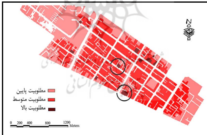
شکل (۵) سناریوی چهارم: تلفیق و وزندهی لایه ها به روش Structured AHP