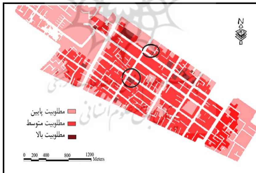
شکل (۳) سناریوی دوم: تلفیق و وزندهی لایه ها به روش Fuzzy AHP