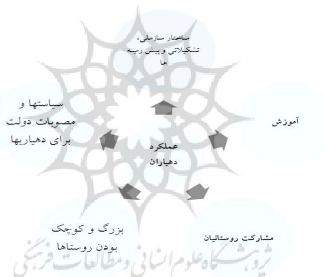
شکل شماره ۱- مدل تحلیلی تحقیق

دهیارها، ۱۳۸۳: ص ۹-۱۲). از اینرو، ضروری است عملکرد دهیاران در توسعه و مدیریت روستایی مورد بررسی قرار گیرد تا زمینه مناسبی برای افزایش توانمندیها و رفع کاستی‌های آنها فراهم شود (سازمان شهرداری ها و دهیاری های کشور، ۱۳۸۸).