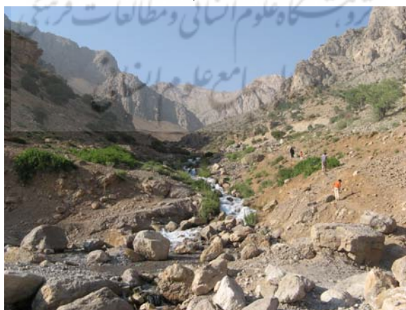
شکل شماره ۱: تصویری از چشم انداز عمومی محوطه چشمه میشی

این منطقه در ۵ کیلومتری شمال شرقی شهر سی سخت قرار دارد و از نظر موقعیت جغرافیایی در ۵۱ درجه و ۲۹ دقیقه طول شرقی و ۳۰ درجه و ۵۲ دقیقه عرض شمالی قرار دارد. متوسط ارتفاع محوطه ۲۴۷۰ متر از سطح دریا است و از موقعیت مناسبی برای ایجاد تفرجگاه برخوردار است. مهمترین پدیده جاذب گردشگری در این منطقه، چشمه میشی است. آب این چشمه که از کوه دنا سرچشمه می‌گیرد همراه با سرسبزی پیرامون این چشمه نمای طبیعی بسیار زیبایی برای گذراندن اوقات فراغت فراهم آورده است. از جمله ویژگی‌های این منطقه، عبارتند از: چشم انداز طبیعی زیبا، افق دید گسترده، دسترسی آسان، فضای قابل توسعه و امکان پیوند با اقتصاد محلی (فضای پیرامون منطقه توسط باغ‌های گسترده انگور احاطه شده است). مجموعه عوامل بالا زمینه را برای لذت بردن گردشگران از محیط اطراف چشمه میشی فراهم کرده است (همان، ۱۳۸۶).