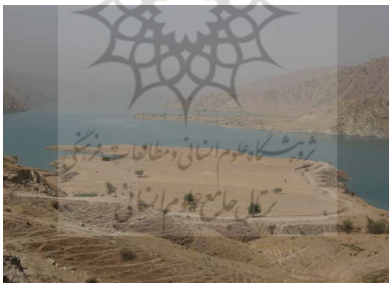
شکل شماره ۵: تصویر منطقه منتخب برای بارگذاری در کنار دریاچه سد کوثر

همچون نبود فضای قابل توسعه و قابل به کارگیری برای توسعه تأسیسات مختلف گردشگری- روبه رو است. این در حالی است که پهنه دریاچه سد از ظرفیت بالایی برای توسعه فعالیت‌های مرتبط با گردشگری برخوردار است، در این راستا، فرآیندهای آماده‌سازی، زمینه لازم را برای بهره‌گیری از توانمندی‌های دریاچه سد فراهم کرد. از جمله ویژگی‌های این منطقه می‌توان به قرارگیری آن در همسایگی دریاچه سد، واقع شدن در حد فاصل شهرستان‌های دهدشت و گچساران، نزدیکی به شهر چرام، عدم مشکل مالکیت و فضای مسطح آن اشاره کرد که زمینه را برای استقرار تأسیسات خدماتی و جانبی فراهم می‌کند. نکته دیگر در پیوند با این منطقه، نقش و اهمیت درآمدهای ناشی از توسعه فعالیت‌های گردشگری در روستاهای واقع در مجاورت سد است، زیرا بخش اعظم زمین‌های کشاورزی این روستاها به زیر دریاچه سد رفته و اقتصاد منطقه را که برپایه زراعت بوده، با خطر جدی روبه‌رو کرده است.