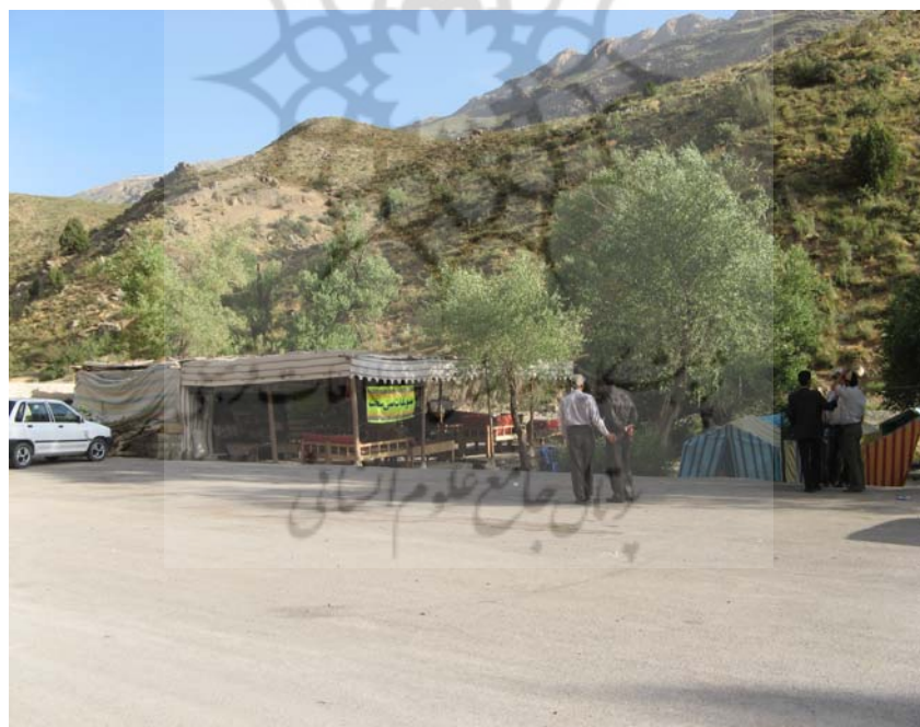
شکل شماره ۲: نمایی عمومی از محوطه کوه گل

برخی ویژگی‌های این منطقه عبارت است از: عبور رودخانه زیبای کوه گل از درون منطقه، وجود دو دریاچه دایمی و فصلی که آب آن از ذوب برف‌های ارتفاعات دنا تأمین می‌شود، وجود چشمه سارهای متعدد و چمنزارهای گسترده اطراف آنها، فضای گسترده قابل بارگذاری، وجود مراکز خدماتی و کمپینگ برای اقامت گردشگران، جنگل‌های کوهستانی، هوای مطبوع و چشم انداز بکر و بدیع و دسترسی آسان (همان، ۱۳۸۶).