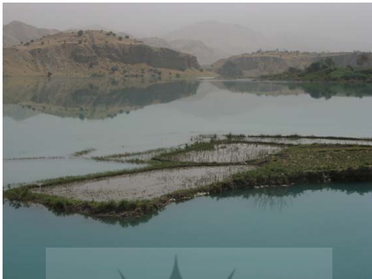
شکل شماره ۶: تصویر اراضی زیر آب رفته روستاهای مجاور سد