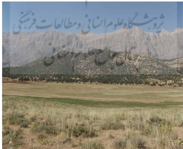
شکل شماره ۳: تصویری از محوطه دشتک

این محوطه در موقعیت جغرافیایی ۵۱ درجه و ۲۳ دقیقه طول شرقی و ۳۰ درجه و ۵۴ دقیقه عرض شمالی واقع است. متوسط ارتفاع این دشت کوچک، ۲۲۲۵ متر از سطح دریاست. دشتک، پهنه‌ای نسبتاً هموار با مساحت تقریبی ۲۰ هکتار در فاصله ۱۰ کیلومتری شمال غربی شهر سی سخت در کنار جاده دسترسی سی سخت به توت‌نده واقع شده است. این پهنه که به طور کامل در منطقه حفاظت شده دنا قرار گرفته است، برخلاف محوطه چشمه میشی و کوه گل تقریباً هیچ جاذبه شاخصی که توانایی جذب مسافران و گردشگران را داشته باشد، ندارد. زمین کاملاً بایر است و دارای پوشش مرتعی است. ضلع شرقی آن یونجه زار است که در ادامه به رشته کوه دنا محدود می‌گردد. در ضلع شمالی و غربی آن باغ‌هایی به صورت پراکنده و عموماً جوان وجود دارد و بقیه را جنگل‌های بلوط پوشانیده است. در انتها الیه شمالی آن، چشمه‌ای بسیار کوچک وجود دارد که تقریباً آبدهی آن فصلی است. ضلع جنوبی پهنه هم منتهی به جاده آسفالت‌سی سخت به توت‌نده است. تقریباً در فضای محوطه هیچ گونه درختی وجود ندارد و به گفته مقام‌های محلی تنها در روزهای بهاری و در ایام تعطیلات نوروز مردم سی سخت اوقات فراغت و تفریحات خود را در آنجا سپری می‌کنند (همان، ۱۳۸۶).