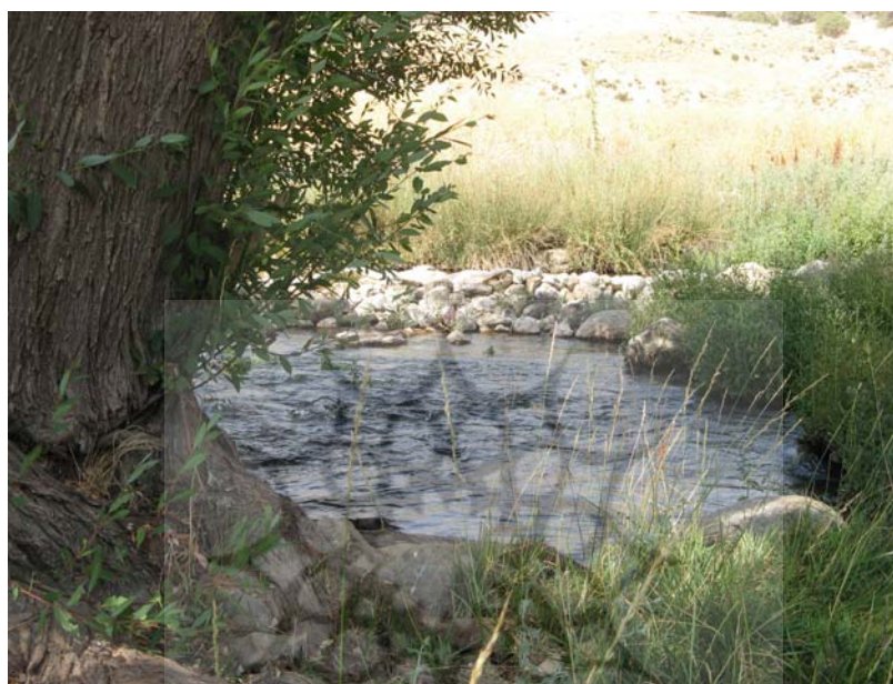
شکل شماره ۸: تصویر نمایی از چشمه سرکورته طسوج

محوطه به شمار می‌رود که دسترسی به آن از طریق جاده خاکی دهدشت - یاسوج امکان‌پذیر است؛ نبود تسهیلات خدماتی، ارتباطی و فاصله زیاد دسترسی به این نقطه را با محدودیت‌های بسیاری روبه‌رو کرده است (همان، ۱۳۸۶).