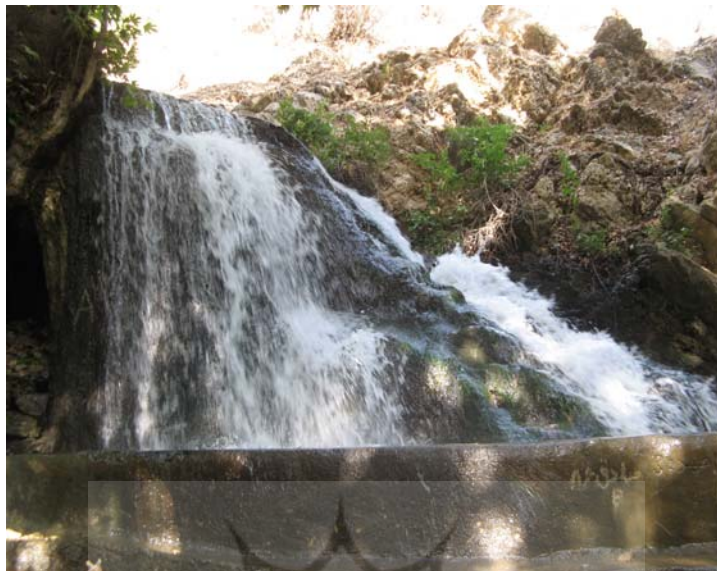
شکل شماره ۹: تصویرنمایی از آبشار زیبای منطقه طسوج

از جمله ویژگی‌های شاخص آن می‌توان به وجود آبشار زیبای طسوج و پوشش جنگلی و چشم اندازهای طبیعی بکر واقع در مسیر اشاره کرد. دسترسی به این نقطه نیز واجد مشکلاتی، چون طی مسیر طولانی و نامناسب و صرف زمان بالاست. اگر چه آبشار طسوج از منظر بصری، ارزش فراوان دارد؛ لیکن نبود بسترهای مناسب برای توسعه زیرساخت‌ها و مانند آن باعث شده تا سطح تقاضا برای بازدید از این منطقه بسیار کم باشد (همان، ۱۳۸۶). در مجموع، این داشته‌ها، اگرچه برای فعالیت‌های طبیعت‌گردی و علاقه‌مندان گشت در دامان طبیعت بسیار منحصر به فرد است؛ اما به دلیل عدم جاذبه شاخصی که مقصد را پیرامون آن سامان داد، به شیوه‌ای که بتوان نوعی هویت به محدوده بخشید، بیشتر برای ایجاد و توسعه محور طبیعت‌گردی مناسب است.