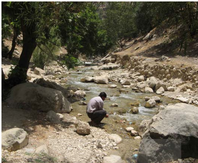
شکل شماره ۷: تصویر نمای عمومی تنگه شراب گوروه

ورودی تنگه به دلیل وجود مسیلی که در آنجا موجود است، نیازمند پلی است که هم اکنون توسط اداره میراث فرهنگی، صنایع دستی و گردشگری شهرستان دهدشت در حال احداث است. در صورت ایجاد امکانات و شرایط لازم برای مردم می تواند به مقصدی مناسب برای فعالیت‌های فراغتی و حتی گردشگری بدل گردد.