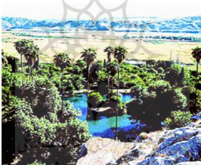
شکل شماره ۱۰: تصویر منطقه زیبای چشمه بلقیس

هم اکنون در ایام تابستان، روزانه به طور متوسط پذیرای صدها گردشگر بومی و خوزستانی است که تمام روز خودشان را در آنجا می‌گذرانند. شایان ذکر است که شهر چرام در ارایه خدمات به گردشگران و مخاطبان چشمه بلقیس نقش مهمی را ایفا می‌کند.