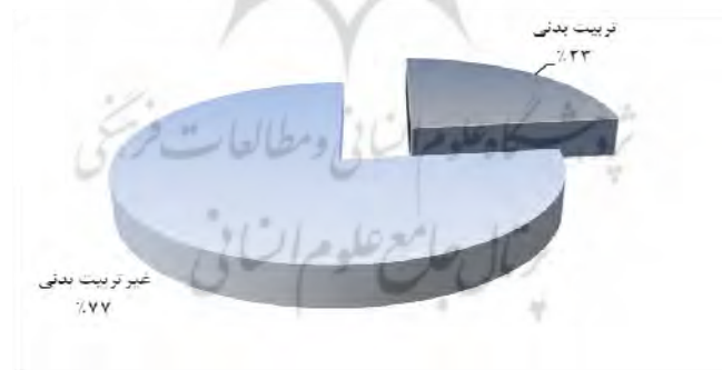
شکل ۲- توزیع درصد فراوانی رشته تحصیلی کارشناسان سازمان تربیت بدنی

باتوجه به اطلاعات برگرفته از ویژگی‌های جمعیت‌شناختی کارشناسان سازمان تربیت بدنی، ۲۳ درصد کارشناسان مورد بررسی دارای مدرک تربیت بدنی و ۷۷ درصد آنان در دیگر رشته‌ها تحصیل کرده‌اند، درحالی‌که همه متخصصان مورد بررسی دارای مدرک دکتری در رشته تربیت بدنی با گرایش مدیریت و برنامه‌ریزی هستند (شکل ۲).