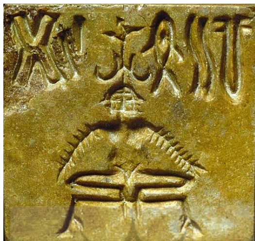
تصویر ۲- مهر سفالین، مکشوفه از تمدن دره سند، رب النوع سه سر.