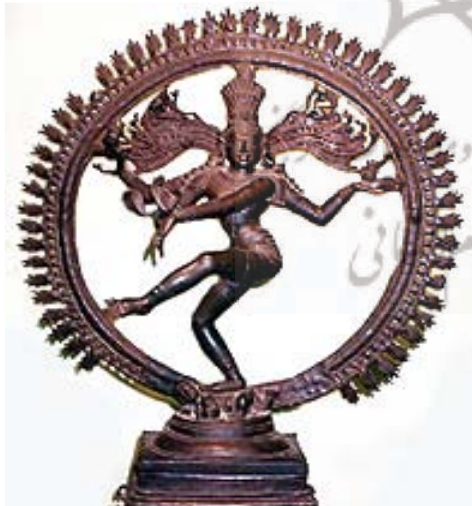
تصویر ۵- شیوا در مقام نیتاراجا، رقاصل کیهانی، برنزا، هند جنوبی. (کوماراسوامی، ۱۳۸۲: ۱۴۵)

کیش «بهاگاواتا» مبحث یکتا پرستی و طریق محبت و عشق را عرضه می داشت. آئین «بهاگاواتا» منجر به مذهب «ویشنوی» گردید که پیروان آن، ویشنو را اصل ممتاز می دانند. فرقه دیگری به نام «پاشوپاتا» که «شیوا»، اصل فانی کننده عالم را می پرستیدند نیز در این دوره ظاهر شد که بعد ها به صورت مذهب «شیوایی» درآمد.