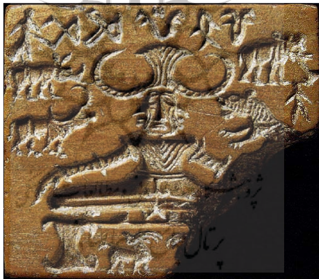
تصویر ۱- خدای چهارپایان با سه چهره، مهر سنگی، هاراپا. موهنجودارو، هزاره سوم پیش از میلاد، سنگ صابون، موزه آثار عتیقه آسیای مرکزی، دهلی نو. (گاردنر، ۱۳۸۴: ۶۸۳)

وفور اشیا باستانی کوچک در اکتشافات مناطق تمدن دره سند، از دوره انتقال از عصر حجر به عصر مس حکایت می کند. فرهنگ مس سنگی در همه جا با خصایلی چون مادر سالاری، نیایش الهه مادر و عبادت نیروهای باروری طبیعت همراه بوده است. اهمیت نیروی باروری، حاصلخیزی و توالد در نیایش الهه باروری یا الهه مادر بروز می کند، که در برخی از رب النوع های باروری با تکرر سینه ها یا سایر نمادهای توالد همراه است. « از آنجا که اقوام دراویدی مردمی کشاورز و یکجا نشین بودند، خدایانی را نیایش می کردند که ارتباط نزدیک به خاکی داشتند که بر روی آن ساکن بودند. این خدایان به گونه ای با باروری و حاصلخیزی پیوند داشتند. در این کیش، خدا بانوی مادر بسیار مورد توجه قرار می گرفت که نمونه هایی از آن در مهرهای یافته شده در هاراپا می توان دید.» (بستار، ۱۳۸۸: ۲۸)