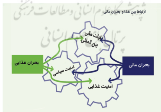
شکل شماره ۲. ارتباط بحران مالی با بحران غذایی

یکی از عمده‌ترین عواملی که همواره قیمت مواد غذایی را تحت تأثیر قرار داده است، مسئله احتکار بوده است. با بروز بحران مالی ایالات متحده در سال ۲۰۰۸، بسیاری از کسانی که سرمایه‌های خود را در بازار مسکن یا بازارهای دیگر سرمایه‌گذاری کرده بودند، آن را روانه بازارهای مواد خام نمودند. احتکار به معنی فرض ریسک از دست دادن سرمایه در عوض احتمال نامطمئن سود است. به طور عامیانه تعریف احتکار خرید کالا برای فروش و آزادسازی در آینده به جای مصرف در زمان کنونی است. احتکار کالا شامل خرید، نگهداری، فروش و خرید موقت سهام، اوراق بهادار، مواد خام یا هر ابزار مالی ارزشمند برای سود بردن از نوسانات قیمت آن در برابر خرید به قصد مصرف است. در چهارچوب بازار مواد غذایی، محتکران کسانی هستند که متحمل ریسک نسبی می‌شوند. احتکار مواد غذایی به عنوان یکی از عوامل مؤثر بر افزایش قیمت، نیاز به تنظیمات خاصی در سطح مؤسسات جهانی دارد که تا به حال مفقود بوده است. راه حلی جهانی برای جلوگیری از احتکارات بیشتر دربردارنده هزینه‌های بسیاری است، اما در مقایسه با زیان‌های افزایش قیمت نظیر آنچه در سال ۲۰۰۸-۲۰۰۷ اتفاق افتاد هنوز این سیاست بازدهی بیشتری خواهد داشت. (۱۲) نمودار ذیل ارتباط بحران غذایی را با بحران مالی اخیر نشان می‌دهد.