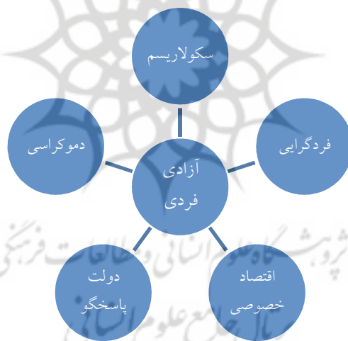
نمودار مفصل‌بندی گفتمان لیبرال دموکراسی

ولی از آنجاکه خواسته‌های افراد تابعی از شرایط اجتماعی است، محدوده و مصادیق آزادی و مدل اقتصادی مطلوب هیچگاه به قطعیت نمی‌رسند و دائماً شناور هستند. با ملاحظه موارد فوق باید گفت مهم‌ترین دال‌ها و از جمله دال برتر گفتمان لیبرال دموکراسی در گفتمان آیت‌الله سیستانی حضور دارد ولی با این تفاوت که در لیبرال دموکراسی، خواست شناور مردم معنابخش این دال‌هاست ولی در گفتمان آیت‌الله سیستانی، توحید و استلزامات معنایی آن، به دال‌ها هویت و معنا می‌بخشد. ویژگی توحید به نحوی است که منطق نظریه تحلیل گفتمان در تبیین این «دال همیشه ثابت و به قطعیت رسیده»، ناتوان است و حداکثر توانایی آن در توجه به دیگر دال‌ها و مصادیق آنهاست؛ مصادیقی که در زمان‌های مختلف، تغییر می‌کند و بر اساس شرایط مکانی و زمانی، امور مختلفی، مصداق دال خاصی محسوب می‌شود.