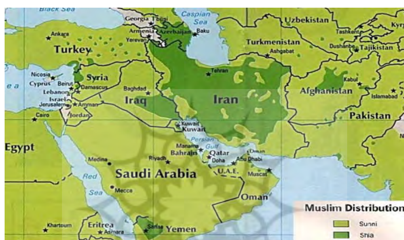
نقشه شماره ۱: جغرافیای شیعه (Nasr, 2006: 25)

می‌شوند. در این میان ایران با اکثریت مطلق ۹۰ درصد شیعه که ۶۸ میلیون نفر از جمعیت این کشور هستند، قلب ژئوپلیتیک شیعه و تنها دولت شیعی قبل از تحولات اخیر در عراق محسوب می‌شد و مرکز اصلی مذهب شیعه و حمایت از شیعیان تحت لوای نظام جمهوری اسلامی ایران به حساب می‌آمد (Ahmadi, 2010: 48).