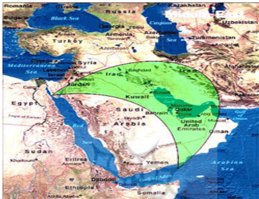
نقشه شماره ۲: تمرکز ژئواستراتژیک شیعیان در خاورمیانه (Thompson, 2009: 23)