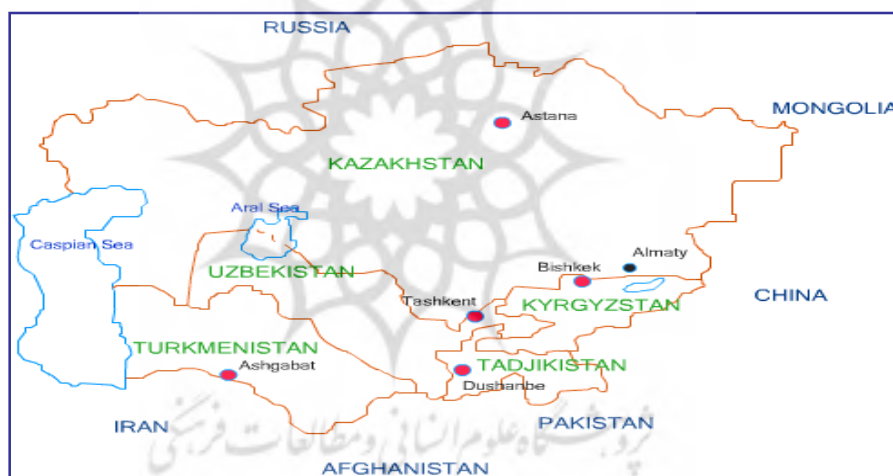
نقشه شماره ۱: آسیای مرکزی؛ (Ibid)

مختلف، در ساختار قدرت منطقه سهمی برای خود بیابند. از این‌رو، در سال‌های اولیه پس از استقلال با توجه به معطوف شدن توجه روسیه به مشکلات داخلی، فرصتی برای قدرت‌های منطقه‌ای و فرامنطقه‌ای به وجود آمد. تا با توجه به عواملی همچون ارزش ژئوپلیتیک و ژئواستراتژیک آسیای مرکزی و قفقاز، منابع و ذخایر فراوان نفت و گاز خزر، موقعیت گذرگاهی، ارتباطی و ارزش استراتژیک دریای خزر و دریای سیاه، کنترل تولید منابع و خطوط لوله انرژی، توان تأثیرگذاری بر بحران‌های منطقه و علایق مشترک فرهنگی، تاریخی و اقتصادی میان کشورهای منطقه برخی همسایگان، برای تحقق اهداف خود و پر کردن خلاء قدرت در آسیای مرکزی و قفقاز به رقابت با یکدیگر پردازند (Hafeznia & et al, 2007: 97).