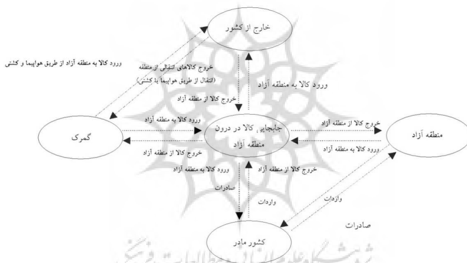
شکل شماره ۱: تعاملات فضایی خارجی در منطقه آزاد (ولی قلی‌زاده، ۱۳۸۸: ۶۱)

پیوند اقتصاد داخلی به اقتصادهای منطقه‌ای، جهانی بهترین توجیه برای نقش ژئواکونومیک این مناطق به‌شمار می‌رود. در همین راستا، یک منطقه آزاد، در نقش ژئوپلیتیک کشور نیز می‌تواند کارساز باشد. به عبارتی، نقش یک منطقه آزاد در همگرایی و فعالیت‌های مشترک اقتصادی کشورهای متفاوت، می‌تواند در شکل‌گیری صلح و امنیت منطقه‌ای نیز نقش بارزی ایفا نماید؛ و حتی به شکل‌گیری و تأسیس یک اتحاد منطقه‌ای نیز بیانجامد.