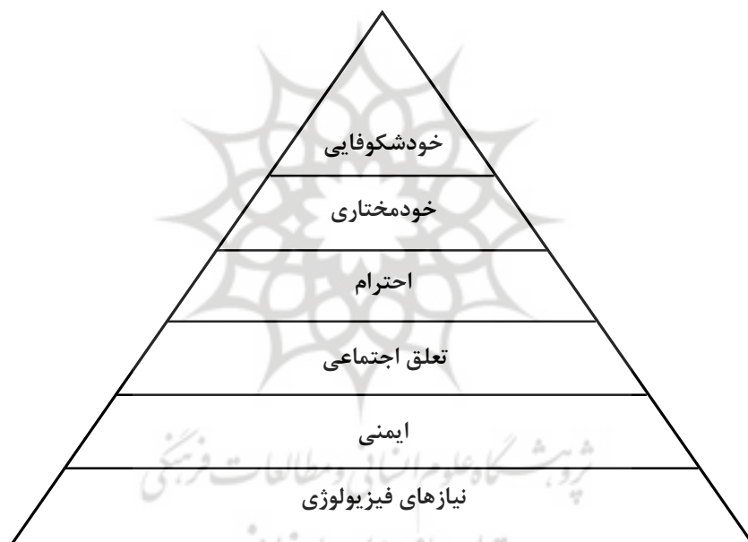
شکل 2: سلسله مراتب نیازهای پورتر

الف) نیاز به پیشرفت/توفیق طلبی ۲ که به معنای انجام اموری برای نشان دادن شایستگی و صلاحیت است، یا به عبارت دیگر، انگیزه برتری جویی و توفیق در ارتباط با مجموعه‌ای از معیارها و تلاش‌ها برای رسیدن به موفقیت (رایبیز، ترجمه: کبیری و همکاران، 1385: 57).