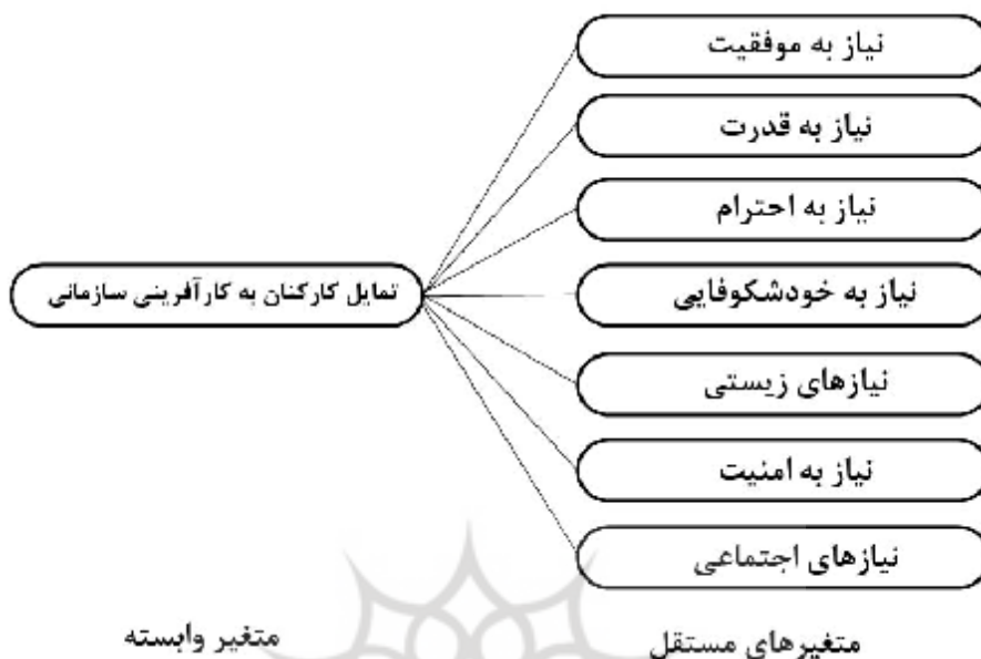
شکل 3: مدل مفهومی تحقیق

وی استفاده از برنامه‌های انگیزشی را از گزاره‌های اصلی برای افزایش روحیات کارآفرینی در سازمان‌ها معرفی کرده است. با توجه به مرور مبانی نظری و پیشینه تحقیق، مدل مفهومی تحقیق به شکل 3، ترسیم شده است.