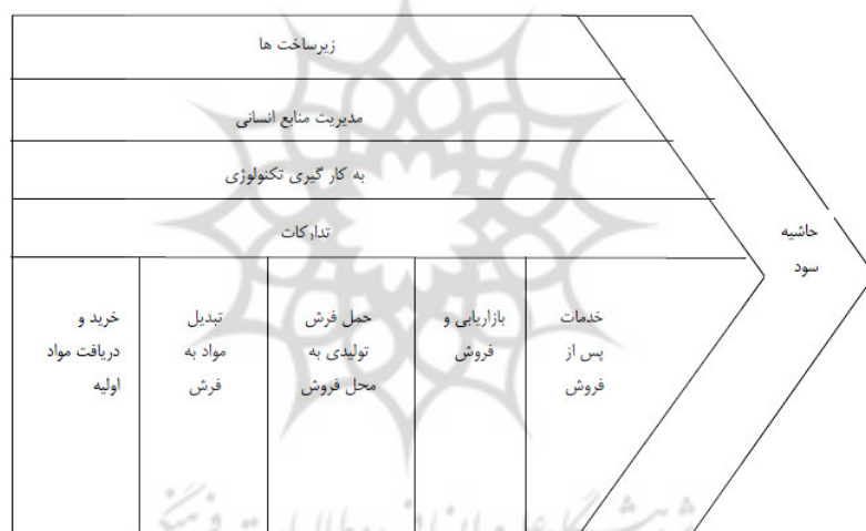
شکل ۲ زنجیره ارزش فرش

۲- فعالیت‌های پشتیبانی: فعالیت‌های پشتیبانی آن دسته از فعالیت‌هایی هستند که حول فعالیت‌های اصلی و برای آماده‌سازی شرایط اجرای آن‌ها انجام می‌شوند. با توجه به مطالب گفته شده می‌توان زنجیره ارزش صنعت فرش را به شرح زیر بیان نمود: