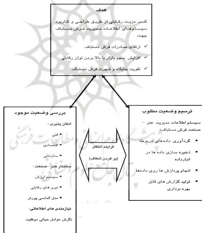
شکل ۴ چارچوب مفهومی پژوهش

با تمرکز بر آن‌ها، نیازهای اطلاعاتی شفاف تر شده و بررسی امکان‌سنجی را به شکلی هدفمندتر در می‌آورد، استفاده شده است و همچنین از ادبیات نظری مربوط به مطالعات امکان‌پذیری توسعه و پیاده‌سازی سیستم‌های اطلاعاتی مدیریت بهره‌برداری شده است. این الگوی مفهومی قصد دارد تا با شناسایی وضعیت موجود سیستم‌های اطلاعاتی، امکان‌سنجی پیاده‌سازی آن‌ها را در صنعت فرش دستباف کشور بسنجد اما باید توجه داشت که با این عمل قصد دستیابی به وضعیت مطلوب صنعت را داشته و با پرکردن شکاف میان این دو وضعیت (موجود و مطلوب) درصدد دستیابی به اهداف پیاده‌سازی سیستم اطلاعات مدیریت که در واقع همان کسب مزیت رقابتی، ارتقای صادرات فرش و افزایش اعتبار و جایگاه آن در بازار است را دارد.