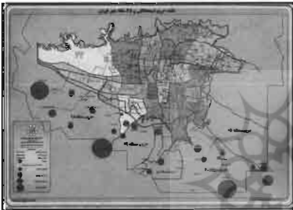
ضرورت ها و محدودیت های موجود.