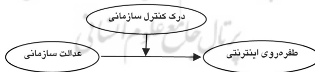
شکل ۱ الگوی مفهومی تحقیق

الگوی مفهومی پژوهش حاضر در شکل ۱ ارائه شده است.