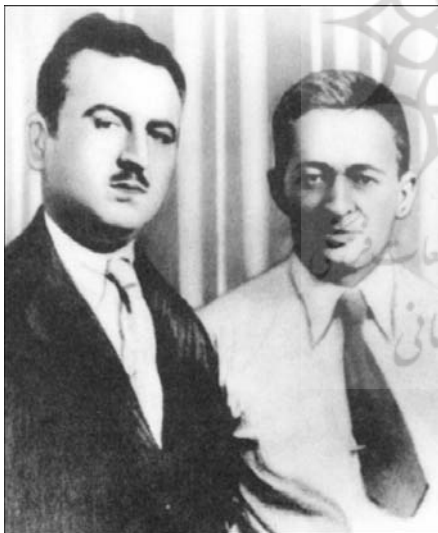
(حبیب لوی با اسحاق بن صوی دومین رئیس جمهوری اسرائیل در سال‌های پیش از تشکیل دولت اسرائیل. این عکس در تهران، منزل دکتر لوی برداشته شده است)

یکی از این ادعاها که بسیار نیز مهم است و عده‌ای آن را جان کلام کتاب‌های لوی می‌دانند، آن است که اسباط دهگانه‌ی بنی اسرائیل در ایران هستند و می‌توان رد پای آنان را در مناطق مختلف جستجو کرد. اگر چه این ادعا تنها با تحقیقات عمدتاً میدانی و ملاحظات عینی و مستقیم لوی در مناطق مختلف ایران طرح شده است ولی عده‌ای همچون ژاله پیر نظر ۲ که دستی در تاریخ نویسی یهودیان ایران دارد نیز، بر قوام این ادعا با ارائه‌ی ادله‌ی دیگر افزوده است. ۳