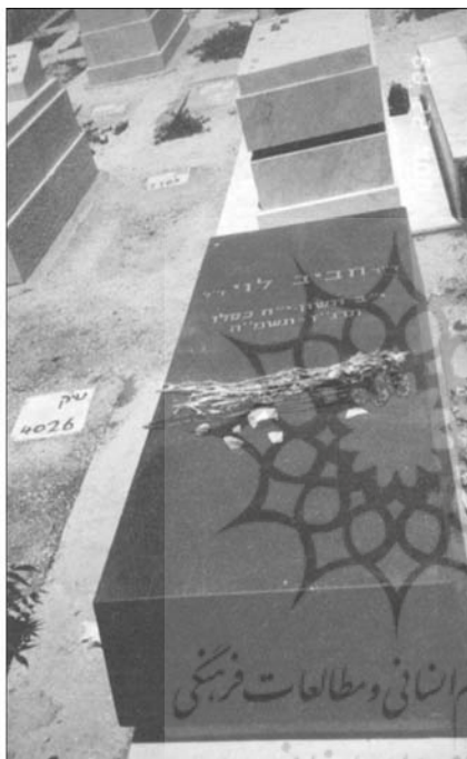
( محل دفن حبیب لوی در بیت المقدس )

یافته‌ها و دیده‌ها و تأملات خود پیرامون یهود ایران نمود. وی در سال ۱۹۸۴ در لس آنجلس از دنیا می‌رود و در فلسطین اشغالی و شهر بیت المقدس دفن می‌شود.