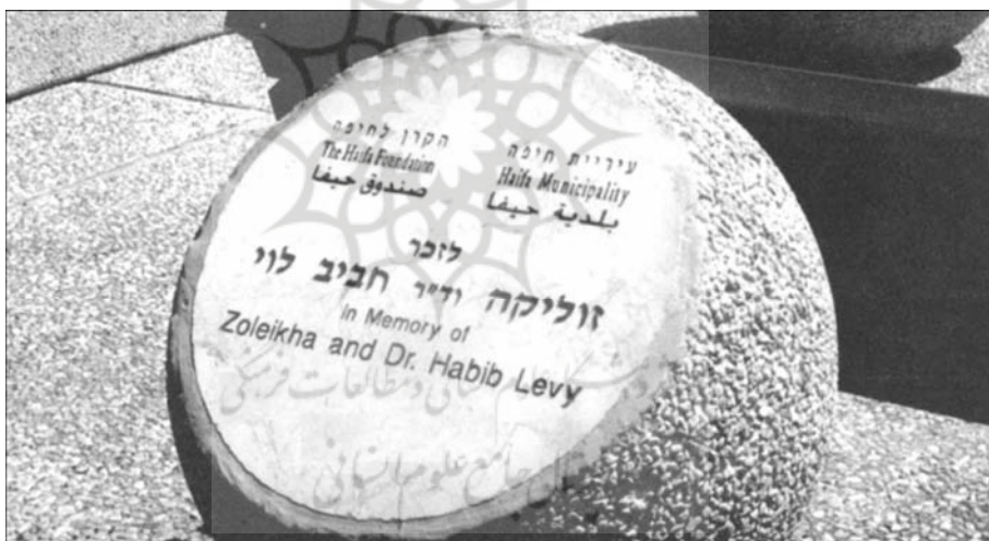
( سنگ بنای یادبود حبیب لوی که شهرداری و بنیاد حیفا آن را به پاس خدمات وی به اسرائیل در شهر حیفا بنا داشته‌اند )

احتمال زیاد یهودیان دماوند از این اسباطند و روزی او را به همراه خود به دماوند و گیلیارد (گیلعد) بردم. آنچه را در ذهن درباره‌ی این قبایل دهگانه اندوخته بودم و بعد خود به صورت کتابی در آوردم که امیدوارم روزی منتشر شود. در اختیار بن صوی گذاشتم. بن صوی بعدا خود در این زمینه، کتاب معروف و کوچک نیدحه ایسرائل را منتشر کرد و اعتراف کرد که قسمتی از اطلاعات مندرج در آن کتاب را من در اختیارش قرار داده‌ام.