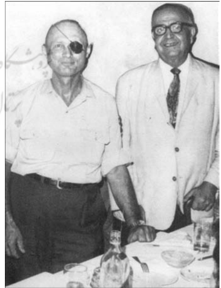
( حبیب لوی با موشه دایان )

آمنون نتصر یکی از نکات مهمی را که در ۳ جلد کتاب تاریخ یهود ایران به عنوان یک اصل نادیده گرفته شده به صورت کلی ذکر می‌کند، قید منابع است. ۲ به چنین نقضی نیز ابرامی اذعان می‌کند و برای اینکه کتاب لوی وجهه‌ای آکادمیک بیابد و در سطح یک اثر کلاسیک باقی نماند، خود