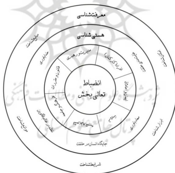
شکل ۴. مدل مفهومی انضباط تعالی بخش بر اساس مبانی شناخت شناسی، هستی شناسی و ابعاد هفت گانه مؤثر

هر مفهوم مبانی و اصول خاص خود را دارد. شهید مرتضی مطهری در کتاب «وحی و نبوت» (۱۳۷۳)، دکتر محمد بهشتی در کتاب «مبانی تربیت از دیدگاه قرآن» (۱۳۸۷)، حجت الاسلام و المسلمین دکتر نقی پورفر در کتاب «اصول مدیریت اسلامی و الگوهای آن» (۱۳۸۳)، دکتر علی احمدی و حجت الاسلام علی احمدی در کتاب «مبانی و اصول مدیریت اسلامی» (۱۳۸۳)، دکتر مرادی و لسانی فشارکی در کتاب «روش تحقیق موضوعی قرآن کریم» (۱۳۸۵) و پایان نامه کارشناسی ارشد آقای حسین عرب اسدی با عنوان «نظام جبران خدمات کارکنان بر مبنای ارزش های اسلامی با تکیه بر سیره حضرت محمد (ص) و حضرت علی (ع)» (۱۳۸۴) تلاش کرده اند مباحث و مسائل خود را بر اساس دو مقوله اساسی مبانی و اصول، تبیین کنند. در نگاه ایشان مبانی، زیربنا و اصول شاخ و برگ برآمده از این مبانی تلقی شده است (لطیفی، ۱۳۸۸، ص ۷۶).