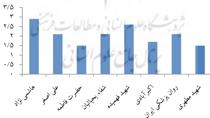
آمادگی تجهیزات ارتباطی

نمودار ۲: شرایط بیمارستان‌ها از لحاظ آمادگی تجهیزات ارتباطی برای استقرار شبکه‌ی مشاوره‌ی پزشکی از راه دور