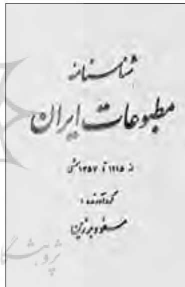
■ مسعود برزین. شناسنامه مطبوعات ایران از ۱۲۱۵ تا ۱۳۵۷، تهران: بهجت، ۱۳۷۱، نوزده + ۵۶۲ صفحه، وزیری.

کتاب حاضر به معرفی ۶۰۰۰ نشریه که در سال‌های ۱۲۱۵ تا ۱۳۵۷، به زبان‌های مختلف در ایران یا خارج از کشور به دست ایرانیان منتشر گردیده است، می‌پردازد.