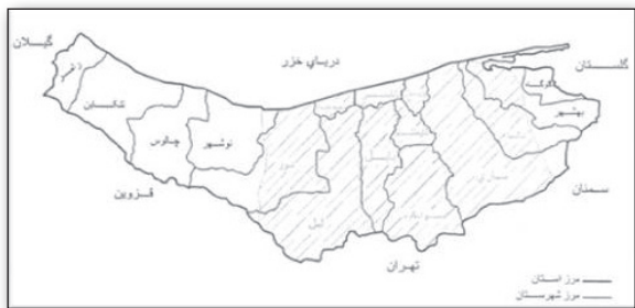
تصویر ۴. محدوده قرارگیری سقانفارها در منطقه مازندران. Fig 4. The location of the Saghanefars in the region of Mazandaran.