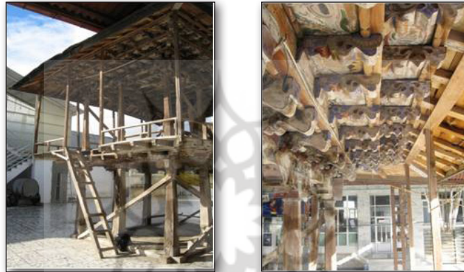
تصاویر ۹ و ۱۰. سقانهفار بیشه سر قائمشهر.