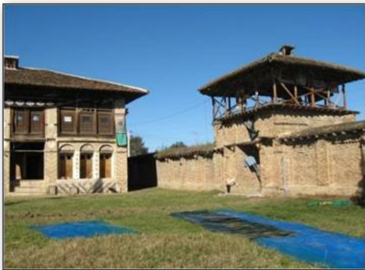
تصویر ۳. سقائفار به مثابه ورودی.