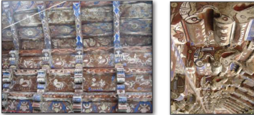
تصاویر ۷ و ۸. سقانهفار شیاده بابل.