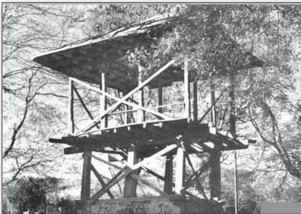
تصویر ۱. شکل اصیل نفار.