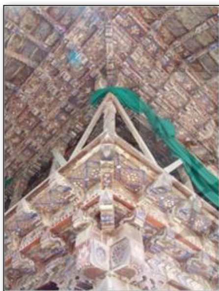
تصویر ۵. سقانفار شباده بابل، پارچه سبز نشان‌دهنده شروع ماه محرم. Fig5. “Shyade Saghanefar” – babil.