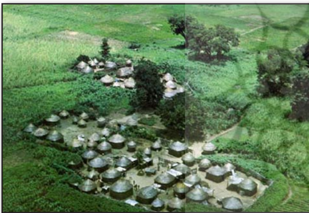
تصویر ۶. یک سکونت‌گاه روستایی در کشور لیبی.