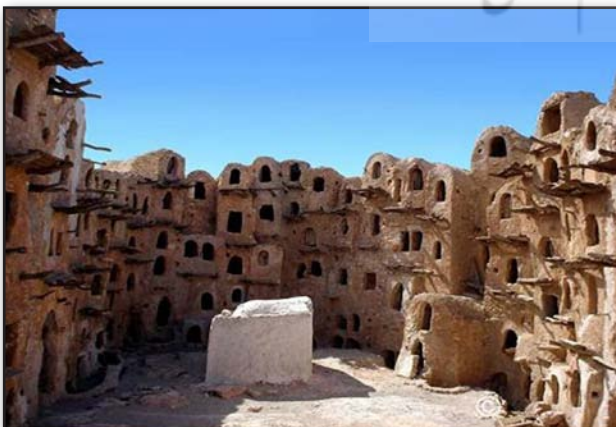
تصویر ۷. یک سکونت‌گاه روستایی در کشور نیجریه.