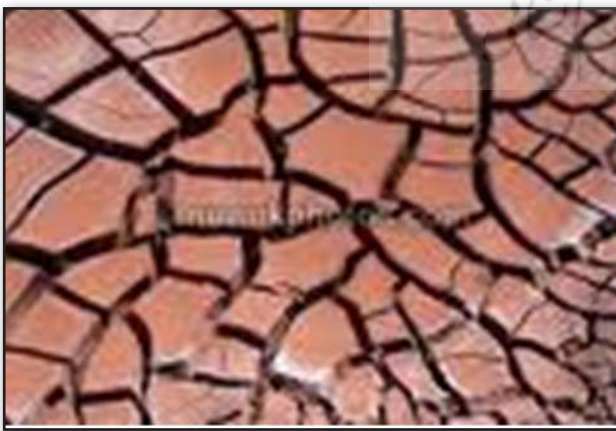
تصویر ۴. طرح طبیعی گل خشک شده.