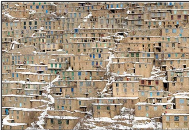
تصویر ۵. روستای اورامان کردستان.