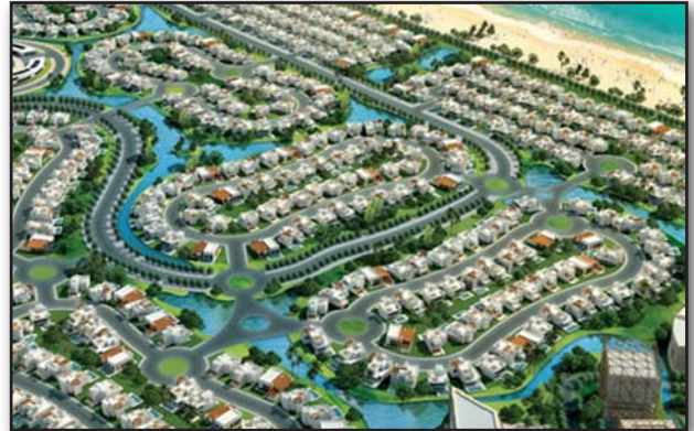
تصویر ۱. طرح یک دهکده ساحلی. مأخذ : http://www.ethic.ly Fig1. Design of a beach village. Source: http://www.ethic.ly