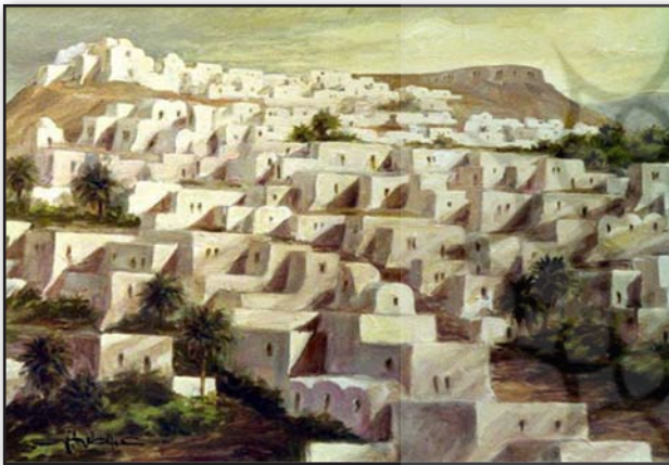
تصویر ۳. تصویر نقاشی شده یک سکونت‌گاه روستایی در کشور لیبی.