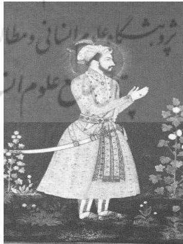
تصویر شماره ۷. شاه جهان

در تابلویی که در موزه ملکه ویکتوریا لندن قرار دارد. شاه جهان را با چقه نشان داده شده است. تاریخ اجرای این نقاشی قرن هفدهم است. (زبروفسکی، ۱۹۸۳: ۱۲۵)