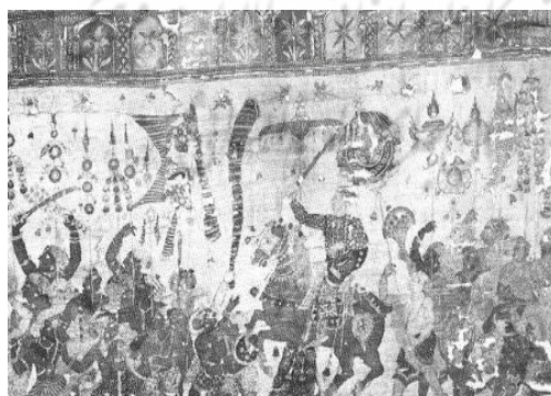
تصویر شماره ۵. کریشنا ایزد هندی

کریشنا ایزد هندی بر فرش نشسته که نقش بُته دارد، ایستاده است. تاریخ این نقاشی سال ۱۶۵۰ میلادی است. (زبروفسکی، ۱۹۸۳: ۲۰۳)