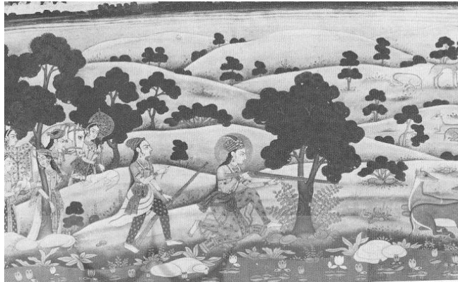
تصویر شماره ۱۰. شاهزاده‌ای در حال شکار

شاهزاده‌ای که شکار می‌کند با جقه نشان داده شده است. مربوط به قرن هجدهم میلادی موزه حیدرآباد هندوستان. (زبروفسکی، ۱۹۸۳: ۲۵۷)