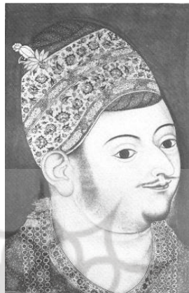
تصویر شماره ۲. سلطان ابراهیم عادلشاه از شاهان شیعه دکن

در نقشی از ابراهیم عادلشاه از شاهان شیعه دکن هندوستان بر کلاه ترمه او نقش بُته مشاهده می‌شود. ترمه به دلیل ظرافت در ساخت کلاه نیز مورد استفاده بوده است. این نقاشی متعلق به سال ۱۵۹۵ میلادی است (تصویر شماره ۲) (Zebrowski:1983:74)