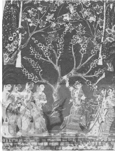
تصویر شماره ۶. همسر حسین نظام شاه از شاهان دکن

همسر حسین نظام شاه یکی از شاهان دکن در کنار سروی نشان داده شده است. سرو متمایل به اوست که اشاره به پادشاهی حسین دارد. این نقاشی متعلق به سال ۱۵۶۵ میلادی است. (زبروفسکی، ۱۹۸۳: ۱۸)