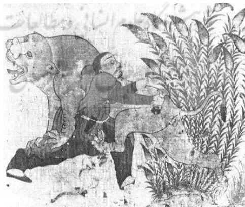
تصویر شماره ۳. مردی که شیری را می‌کشد

در نقاشی مردی که شیری را می‌کشد، بُته مشاهده می‌شود. عصر ارائه این اثر احتمالاً اواسط قرن شانزدهم میلادی است (تصویر شماره ۳). (Zebrowski:1983:101)