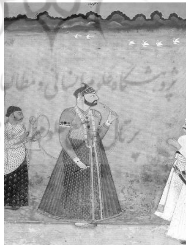
تصویر شماره ۱۱. منیرالملک ملقب به ارسطوجاه

منیرالملک ملقب به ارسطوجاه با جقه نشان داده شده است. تاریخ نقاشی ۱۸۱۰ میلادی حیدرآباد هندوستان است. (زبروفسکی، ۱۹۸۳: ۲۴۸)