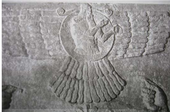
تصویر شماره ۱. ماد آشور خدای آشوریان، عراق موزه بریتانیا، قرن ۷ قبل از میلاد

در فرهنگ آستیک ۱ هندو که خدا محور است، از دایره‌ای به نام ماندالا ۲ سخن به میان می‌آید که مربعی را در دل خود دارد. مربع به مفهوم جهان مادی است و اینکه شاهان خود را سلطان چهارگوشه جهان می‌نامند، به مفهوم سلطه بلامنازع آنهاست. این دایره گاه با بال نمایش داده می‌شود که مفهوم فلسفی سلطه مطلق از آن استنباط می‌شود. بنا به اعتقاد فرقه تانتری ۳ که خود از شعب بودایی‌گری است، منشأ دایره را باید در اعتقادات بوداییان جست‌وجو کرد (جمیز هال، ۱۳۸۰: ۱۶) بعدها بوداییان بر مبنای دایره یا چرخ به دوشعبه ماهایانا ۴ و هینایانا ۵ تقسیم شدند که به مفهوم دایره‌های بزرگ و کوچک است. دایره در اعتقاد هنود و بوداییان به معنای تمرکز است. اما مفهوم دیگری که می‌توان از آن استنباط کرد، شاخ است که به نوبه خود به مفهوم اقتدار است و قدرت مطلق و چنین است که چهره‌های نامدار تاریخی یا پیش از تاریخی را با شاخ نشان می‌دادند. در نمونه‌های مذهبی شیوا و در نمونه‌های اسطوره‌ای رستم و در نمونه‌های تاریخی کوروش قابل ذکر است که به دلیل داشتن شاخ، لقب ذوالقرنین یا صاحب دوشاخ گرفته است.