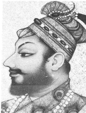
تصویر شماره ۸. علی عادلشاه

در تصویری علی عادلشاه با جقه نشان داده شده است. (زبروفسکی، ۱۹۸۳: ۱۷۶)