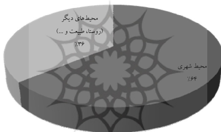
نمودار شماره ۱: جایگاه محیط شهری در داستان‌های کودک و نوجوان دهه شصت

از مجموع ۳۳۵ داستان کودک و نوجوان نوشته شده در دهه شصت، حوادث و رویدادهای ۲۱۶ داستان در شهر رخ می‌دهند که این تعداد ۶۴ درصد از تعداد کل داستان‌ها را به خود اختصاص داده است. شهر در ۱۹۵ داستان در جایگاه محیط اصلی و در ۲۱ اثر دیگر به عنوان بخشی از محیط آن‌ها در کنار محیط‌های دیگر (روستا و طبیعت) قرار گرفته است. از میان این ۲۱۶ داستان، ۳۰ داستان در گروه سنی کودکان و ۱۸۶ داستان در گروه سنی نوجوانان قرار دارند. نمودار شماره ۱ جایگاه محیط شهری و سهم چشم‌گیر آن را در میان محیط‌های دیگر بخوبی نشان داده است: