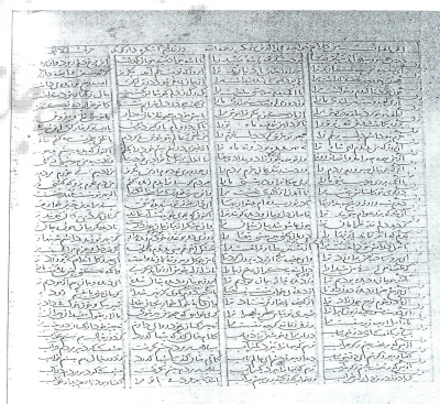
صفحهٔ نخستین نسخهٔ خطی از رباعیات مجد همگر