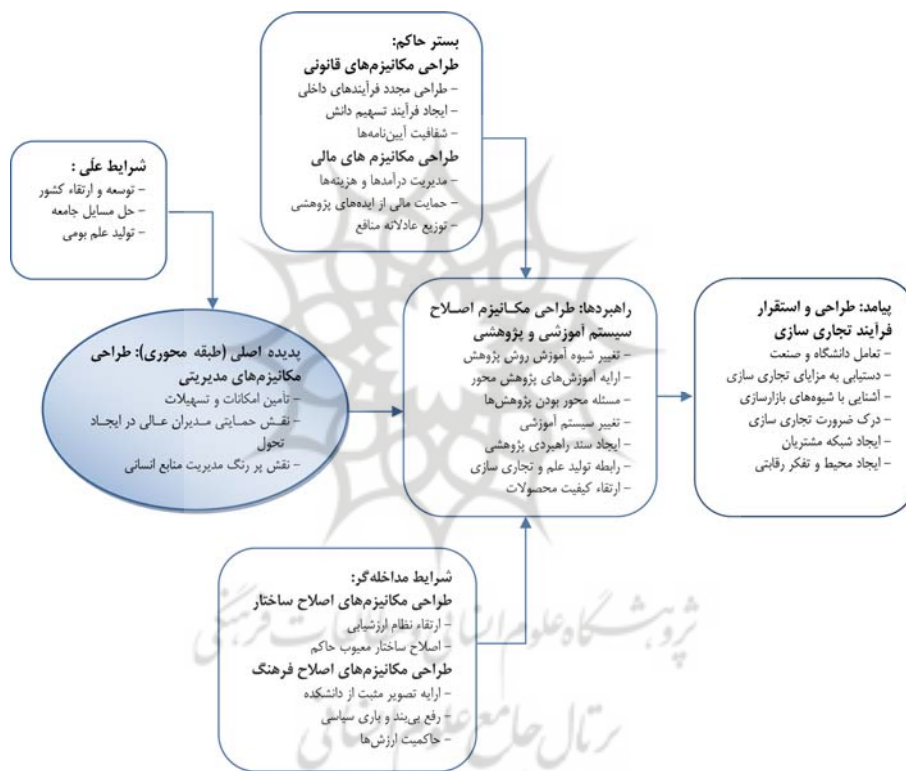
نمودار ۳. کدگذاری محوری براساس مدل (تصویر مدل تکمیلی)

کدگذاری محوری مرحله دوم تجزیه و تحلیل در نظریه پردازی داده بنیاد است. هدف از این مرحله برقراری رابطه بین طبقه‌های تولید شده (در مرحله کدگذاری باز) است. این کار (عمل) بر اساس مدل پارادایم انجام می‌شود و به نظریه پرداز کمک می‌کند تا فرآیند نظریه را به سهولت انجام دهد. اساس فرآیند ارتباط‌دهی در کدگذاری محوری بر بسط و گسترش یکی از طبقه‌ها قرار دارد [۴].