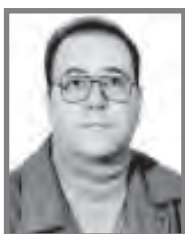
شهراد افشاری نویسنده و روزنامه نگار