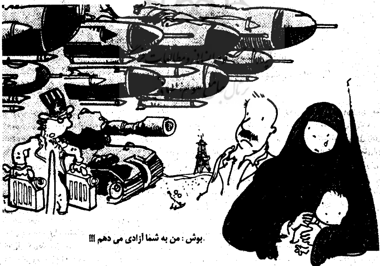
بوش: من به شما آزادی می دهم !!!

می کرد و از دانش و علم شما ستایش می کند، افلاطون نام آن مرد را پرسید و متوجه شد او را می شناسد، فیلسوف زمانی سخت به گریه افتاد.