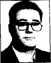
شهراد افشاری روزنامه‌نگار و کارشناس علوم سیاسی