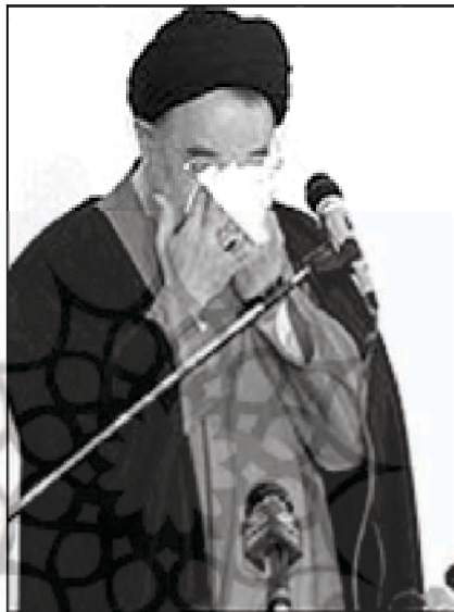
خاتمی در بهار ۱۳۸۰ با آندوه و خستگی برای ثبت نام به ستاد ثبت نام نامزدهای ریاست جمهوری رفت و بغض او در همین جا ترکید

راه چمنی، عضو شورای سیاستگذاری روزنامه همبستگی و نماینده سابق مجلس، نیز معتقد بود که تردید خاتمی به دلایل شخصی، آن هم به علت مشکلاتی بود که