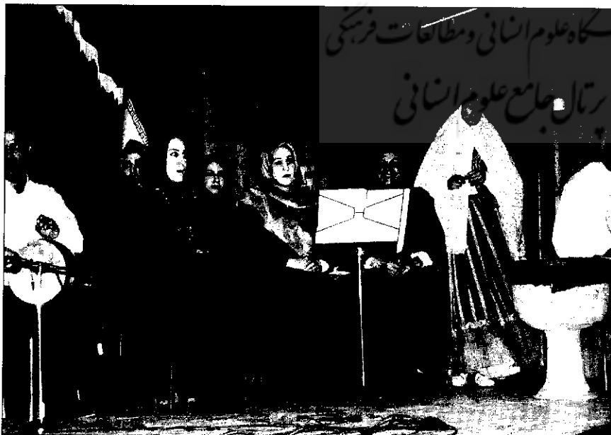
اجرای کنسرت خانم‌ها در تالار اندیشه، در یک شب برفی بهمن ۱۳۷۹

در واقع تحولی آرام، اما عمیق در سیاست‌های