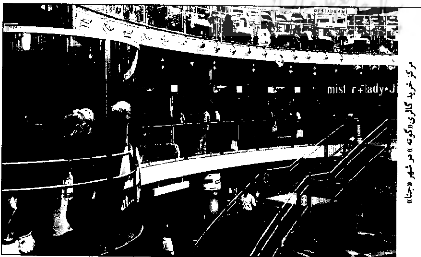
مرکز خرید گالری «گوت» در شهر «جنا»

دو شهر «جنا» و «ولفن» نمادهایی از دو جریان نامتعادل در شرق آلمان هستند که ده سال قبل، پس از فروریزی دیوار برلین به غرب آلمان پیوستند. در سوم اکتبر سال ۱۹۹۰ جمهوری دمکراتیک سابق آلمان موجودیت خود را از دست داد و جذب سرزمین غربی آلمان شد و دیری نپایید که شهروندان آلمان شرقی سابق از مزایای مارک آلمان، مزایای اجتماعی غربی و آزادی‌های مدنی جدید برخوردار شدند، ولی ظاهر شدن نهادهایی چون شهرهای «ولفن» و «جنا» نشان داد که توسعه شرق آلمان تا چه حد با مشکلات پیچیده روبه‌رو است. با هر معیار و محاسبه‌ای وحدت آلمان یک موفقیت سیاسی غیرقابل انکار است. «کورت بیدنکوف» سیاستمداری که به نخست‌وزیری ایالت