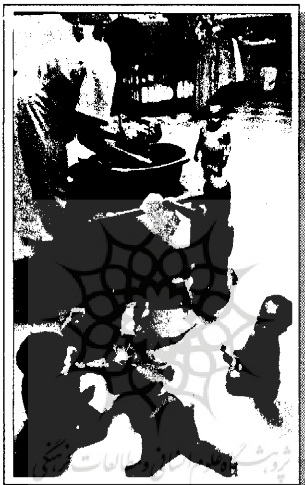
این کودکان هم پدر و مادرشان را از دست داده‌اند و هم خود به ایدز آلوده هستند.

است بیماری ایدز بزرگ‌ترین عامل نسل‌کشی شناخته شده است. خانواده‌ها یکی پس از دیگری نابود می‌شوند و نیروی کار قاره به سرعت روبه اضمحلال است. بیماری ایدز به دلیل بی‌ثباتی اجتماعی و از طریق کارگران مهاجر، آوارگان و پناهندگان ناشی از جنگ‌های محلی و زبانی که بر اثر فقر مفرط تن به فحشا می‌دهند سرتاسر قاره سیاه را آلوده کرده است. عوامل فرهنگی نیز نقش مهمی در این گسترش دارند، خرافات و موهوم‌پرستی که بر بسیاری از جوامع آفریقا حکمفرماست بهترین راه درمان ایدز با مصاحبت یا دوشیزه‌ای باکره تجویز می‌کند که موجب می‌شود گروه‌های بیشتری از دوشیزگان به این بیماری آلوده شوند و بعدها آن را به دیگران منتقل کند.