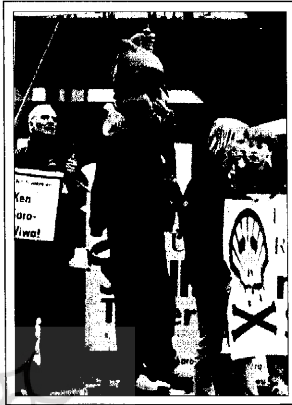
گروهی از مردم هامبورگ با به دار کشیدن آدمکی، صحنه جنایات حکام نظامی نیجریه را به نمایش گذاشته‌اند. آنها آرم «شل» را به شیوه ماهرانه‌ای به صورت اسکلت (نماد مرگ) در آورده‌اند.

است که نظر مردم و انسان‌هایی که می‌خواهند در محیطی ناآلوده زندگی کنند چندان هم بی‌ارزش نیست. در ماه ژوئن گذشته کمپانی شل که تصمیم داشت یک سکوی عظیم نفتی را در دریای شمال به آب بباندازد به دلیل آنکه این سکو می‌توانست آب‌های دریا را آلوده کند با مقاومت حکومت‌های کشورهای آن حوزه روبرو شد و ناگزیر فعالیتش را متوقف کرد. در هفته‌های بعد بار دیگر فعالیت‌های شل بر سر زبان‌ها افتاد و سر خط روزنامه‌های جهان را به خود اختصاص داد: