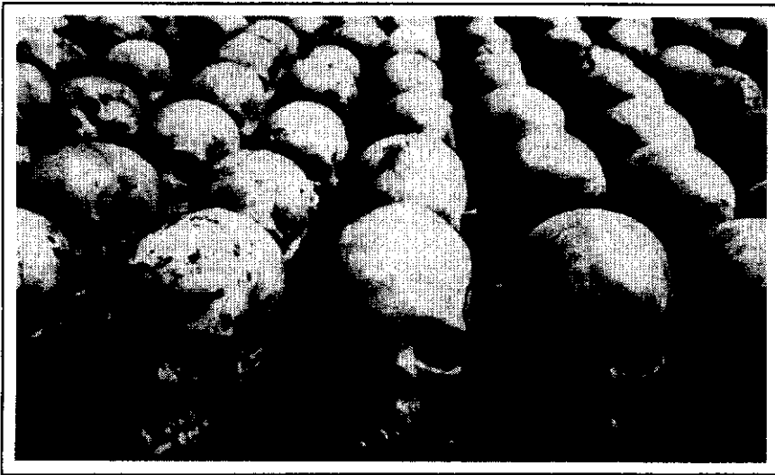
در رواندا، کامبوج، سریلانکا و دیگر نقاط آشوب زده و درگیر با جنگ‌های داخلی، محصول نهایی تجارت سلاح‌های سبک مجموعه‌های انسان‌هایی است که قتل عام می‌شوند.

□ شورشیان آلبانی که سال گذشته به سقوط دولت آن انجامید، موجب شد مقادیر زیادی سلاح‌های سبک به دست شبکه‌های سازمان یافته تبهکاری بیفتند. در این ماجرا یک میلیون قبضه تفنگ از انبارهای ارتش به سرقت رفت و چندی بعد مسلسل‌های کلاشینکف در بازار سیاه