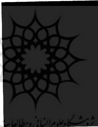
محرمانه آیت‌الله کاشانی

ایران قرار نگرفت. برخی روزنامه‌ها آن را بی‌کم و کاست منتشر کردند، بدون آنکه بر آن تفسیری بنویسند و یا موضوع را پی‌گیری کنند. همان زمان «گزارش» کوشید نظر برخی شخصیت‌های معاصر این رویداد تاریخی را جویا شود؛ اما با حیرت متوجه شدیم آنان نیز به اهمیت این رویداد توجه نداشتند. از جمله وقتی موضوع را با آقای سرهنگ غلامرضا نجاتی نویسنده چند اثر معتبر درباره نهضت ملی شدن نفت و سقوط حکومت ملی دکتر مصدق در میان گذاشتیم از ایشان شنیدیم: