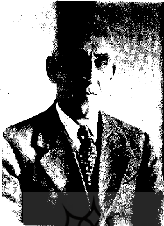
دکتر محمد مصدق رهبر نهضت ملی شدن نفت

نمی‌توان پذیرفت ما به دلیل واقعی اختلاف نظر بین آیت‌الله کاشانی و دکتر مصدق و ایجاد شکاف در نهضت که اجازه داد بدنه‌ای از ارتش و مثنی اوباش دولتی را که تا چند ماه قبل از اقتداری حیرت‌برانگیز برخوردار بود چنان ساده ساقط کنند و آرزوهای یک ملت را بریاد دهند، واقف شده‌ایم.