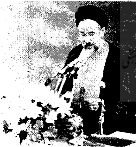
حجت‌الاسلام خاتمی هنگام دفاع از صلاحیت‌های وزرای پیشنهادی خود در مجلس شورای اسلامی (عصر روز ۲۹/۵/۷۶)

در دوره اول باور عمومی این بود که آقای خاتمی ترکیبی را به عنوان هیأت دولت و معاونان خود معرفی خواهد کرد که جامعه در بین آنها از مدیران اجرایی سالهای اخیر چهره‌های بسیار کمی را مشاهده می‌کند. اما در برابر این باور عمومی، جناح‌های سیاسی فهارس مختلفی را به عنوان گزینه اصلی و نهایی رئیس جمهور معرفی می‌کردند. حتی یکی دو روزنامه مبادرت به ارائه لیست‌هایی هم کردند. در این فهرست‌ها اسامی متعددی از وزرای دولت آقای هاشمی رفسنجانی، یا گروه‌هایی که در این دولت سمت‌های اجرایی