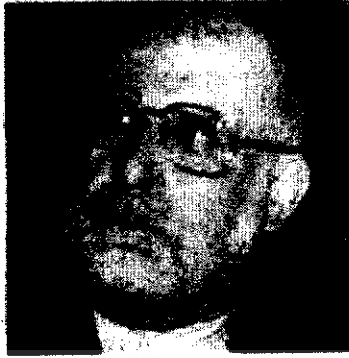
دکتر حبیبی... ابقای ایشان درست معاون اول رئیس‌جمهور مباحث گسترده‌ای را موجب شد

«خبرنگار: جناب آقای خاتمی اولین برنامه‌ای که در دستور کار شما بعد از گرفتن رأی اعتماد مجلس