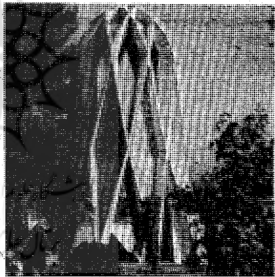
آرامگاه خيام در نیشابور یکی دیگر از جاذبه‌ها...

با داشتن چشم‌اندازی کلی در زمینه توریسم و اهمیت فزاینده آن و توجه به اینکه در حال حاضر