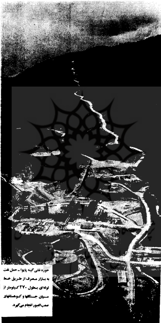
حوزه نفتی گینه پایوا - حمل نفت به بازار مصرف از طریق خط لوله‌ای بطول ۲۷۰ کیلومتر از میان حوضتها و کوهستانهای صعب‌العبور انجام می‌گردد.

نفت در کوزیانا زندگی ما را نابود کرده است، در ژانویه گذشته چریکهای ارتش آزادیبخش ملی کلمبیا یک هلی‌کوپتر را برفراز این میدان نفتی سرنگون کردند و شوهر یکی از قدرتمندترین چهره‌های سیاسی کشور را که در این تأسیسات کار می‌کند ربودند.