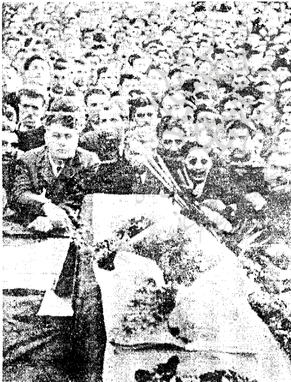
مراسم تشییع جنازه مدیر مرد امروز از انجمن روزنامه‌نگاران تهران تا مزار ابدی‌اش با شرکت در حدود دویست هزار نفر از مردم تهران (بنابه گزارش خبرنگاران داخلی و خارجی) برگزار شد.

فریدون کشاورز در کتاب من متهم می‌کنم با اشاره به تیم تروری که به دستور نورالدین کیانوری و بدون اطلاع هیأت اجرائیه حزب تشکیل شده بود، دوباره قتل محمد مسعود می‌نویسد «روزنامه مرد امروز محمد مسعود را مردم از هم می‌تاییدند و چند ساعت بعد از انتشار آن، قیمتش به ده برابر و بیشتر از آن می‌رسید. آخر محمد مسعود با شجاعت تعجب‌آوری به شاه و خاندان سلطنت و به خصوص به اشرف حمله می‌کرد، حزب در کشتن او چه نفعی داشت، این کار که فقط به نفع دربار بود، کیانوری به کجا بسته بود که چنین کاری کرد؟»