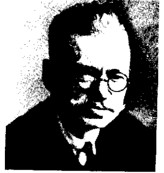
گوردن چایلد (۱۸۹۲-۱۹۵۷)

به تدریج به صورت تصویر پیچیده‌ای از گذشته انسان درمی آید. این شیوه نگرش به گذشته انسان تا دهه دوم قرن بیستم به قوت خود باقی بود تا اینکه گوردن چایلد و دیگران به بررسی دقیقتر و عمیقتر درباره پیچیدگیهای دگرگونی فرهنگی پرداختند.