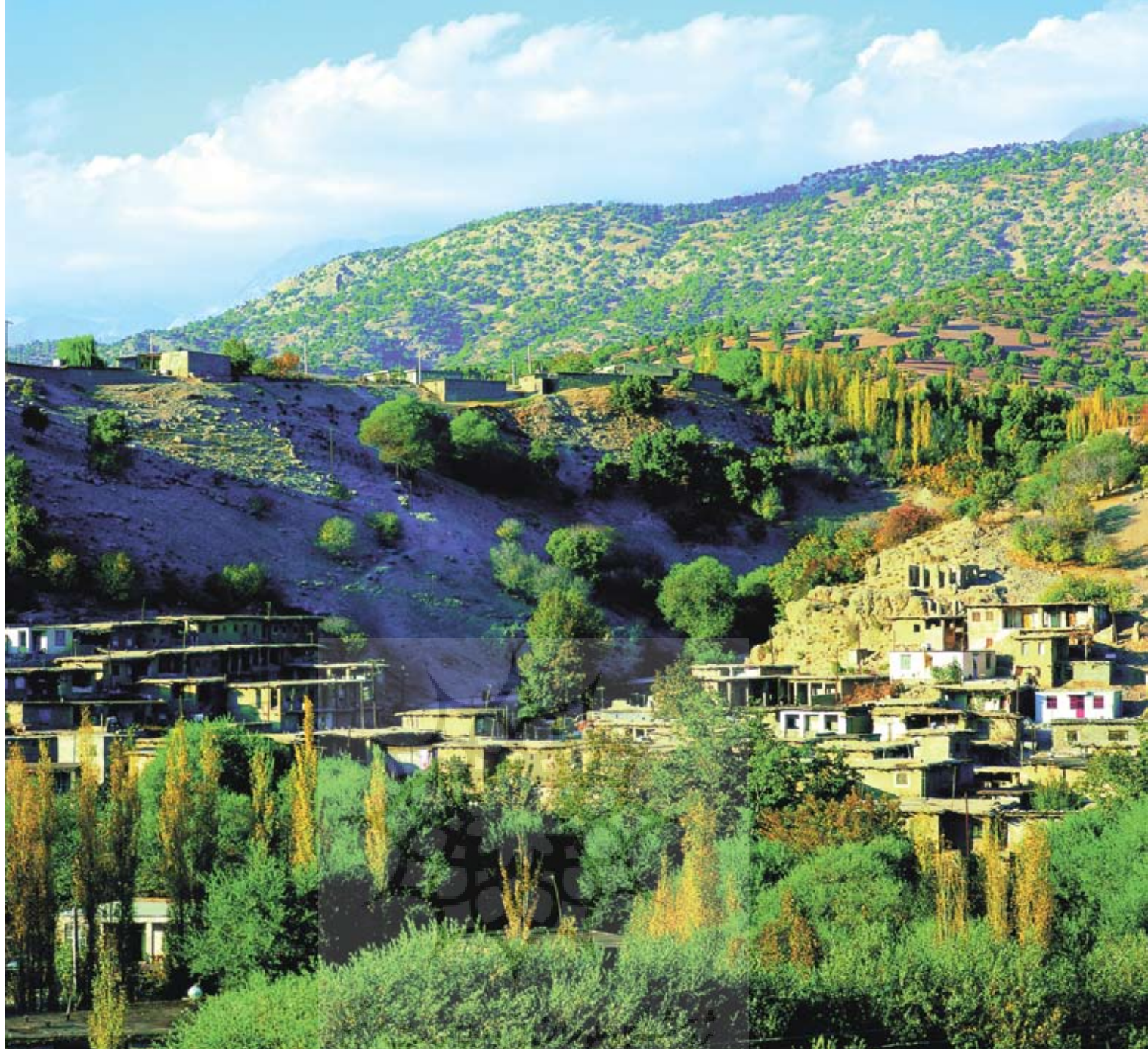
روستای کوخودان در شهرستان دنا منطقه نمونه گردشگری شناخته شده است.

مناسبی برای کوه‌نوردی و کسانی که دل در طبیعت سخت دارند، محسوب می‌شود.