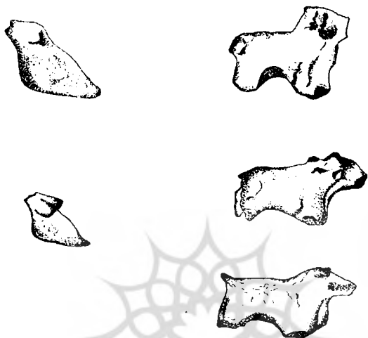
تصویر شماره ۷- پیکرک های حیوانی و انسانی مکشوفه از زاغه سال ۱۳۸۰