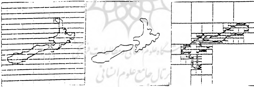
روش راستر (شبکه‌ای)

همواره تفاوتی میان داده‌های مکانی و خصیصه‌ای وجود داشته است. تشخیص بیشتر بین سه شکل و شیوه که در آن داده‌های مکانی در میان یک GIS می‌تواند به ثبت برسد مهم می‌باشد؛ ذخایر وکتور، راستر و کوادتری (شکل ۲) شکل ۲: سه شکل ذخیره‌سازی داده‌ها