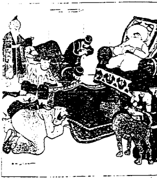
Spontaneous conversion of a Mulla from the Sharifat , 1900, No. 51, Vol. 2, pp. 36-37.