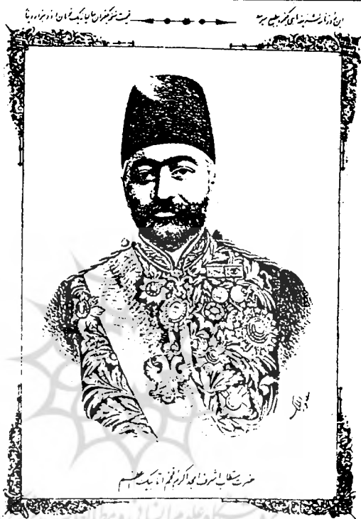
Portrait of Mirza 'Ali Asghar Khan Aminu's-Saltan , by Musavvirul-Mulk From No. 51 of the illustrated monthly Sharifat of Oct.-Nov. 1900