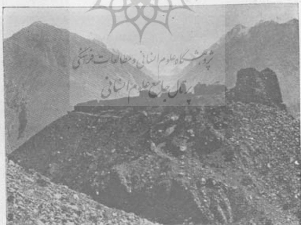
عکس ۴۰۶ - قلعه یا ارک زمرد آتش برست (از طرف شمال)