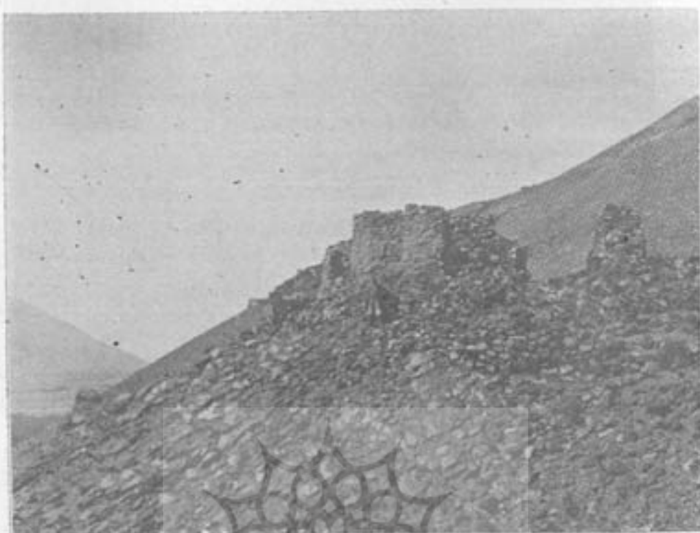
عکس ۴۰۵ - سمت جنوبی استحکامات زمرد رشته دوم دیوار