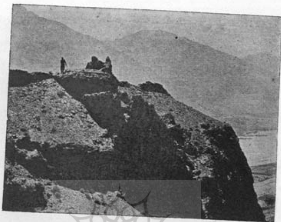
عکس ۴۰۸ - قسمتی از استحکامات خارجی زمزه آتش برست ( از طرف جنوب )