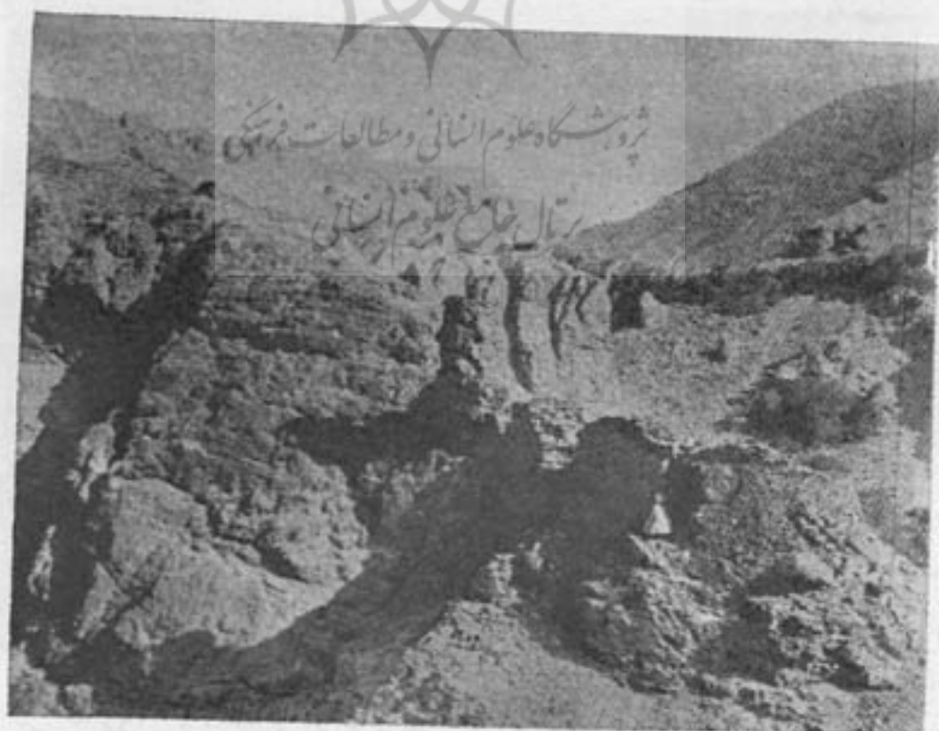
عکس ۴۰۹ - قلعه ذوالنهار از طرف جنوب .