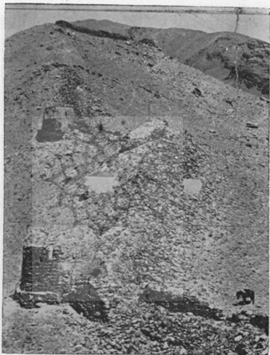
عکس ۴۰۲ - سمت غربی منطقه استعکامات زمر آتش بر ست