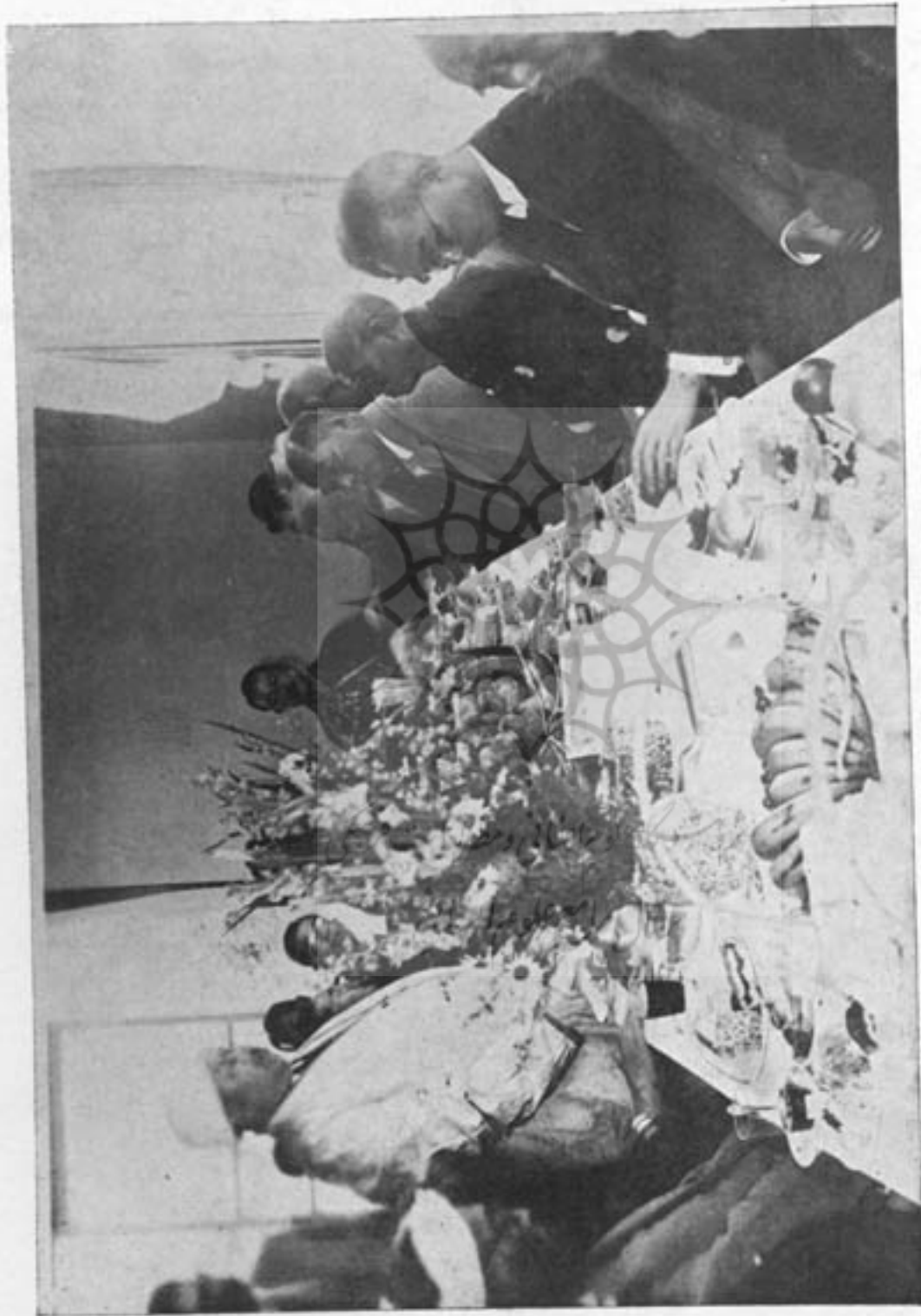
رئیس جمعیت اسلامیہ استاد محمد عبدالحی قربانعلی در حالیکہ بحضور اسرّای بزرگ جاپان و عظمای ملت مذکور در محل نشر قرآن کریم خطابه خود را ابرار میکند .