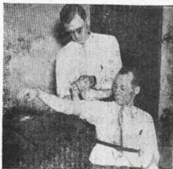
شکل سوم قیمة فشارخون را بسته میکند (متعلق مقاله کشف دروغ)

صحیح و دروغ از یکدیگر تمیز شده بصورت جواب بر ایداء انتخاب نموده گراف های متعدد ترتیب نمود. اگرچه پروفیسر کیلر دعوا ندارد که اسباب او (شکل نمره «۱» قرار یکه از نام آن مفهوم میگردد) کاشف دروغ است چرا که دعواهای حسی که از طرف نگارنده ها و کسانی که حقایق آنها به اساس خوب