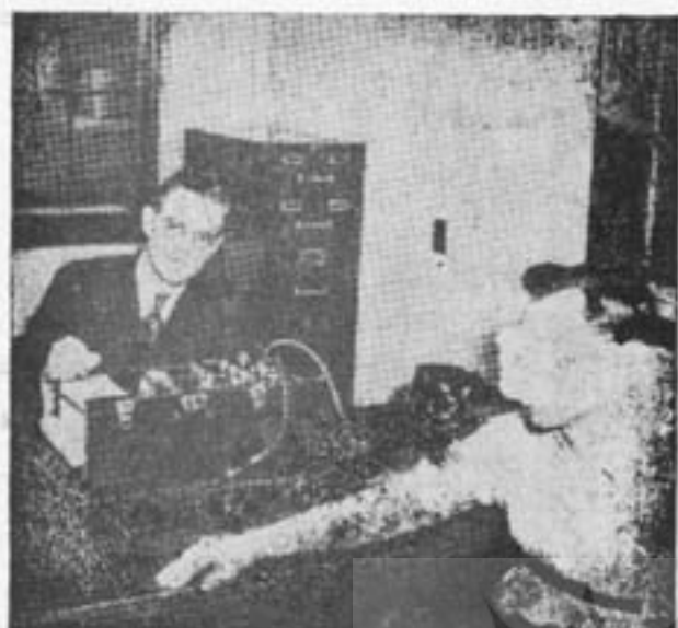
[ شکل اول - مخرب و پالی گراف کبیر ]