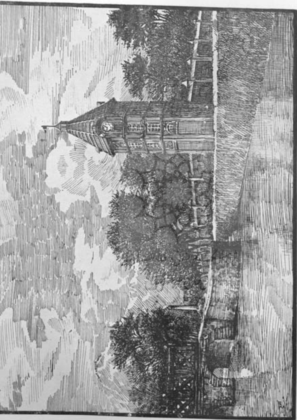
منار ساعت و زارت جلیله حر بیه رو بروی قلعہ محمود خان (در بن عصر فر خندہ ساخته شدہ) متعلق شمارہ ۴ - سال ۵ - آئینہ