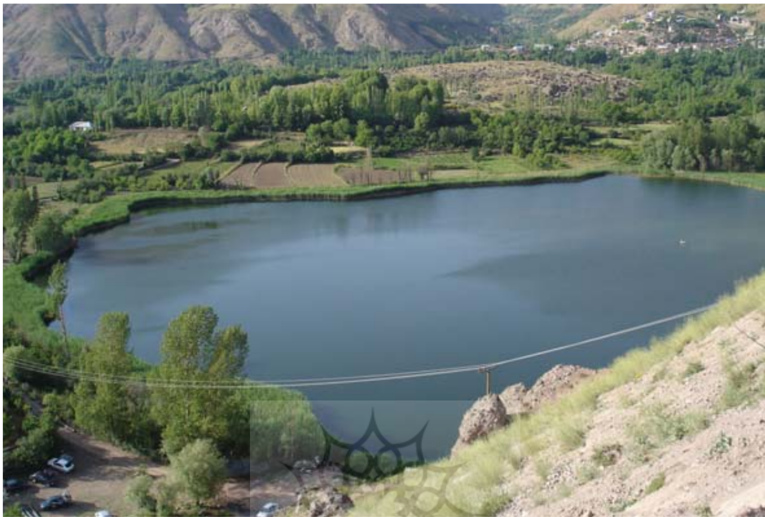
▲ دریاچه اوان، قزوین