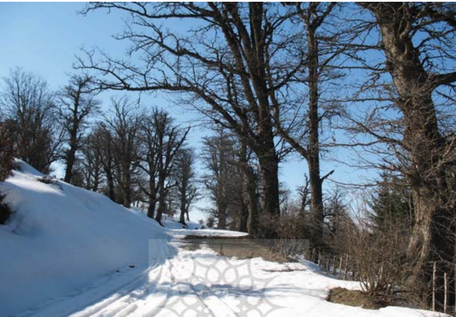
عکس: محمد سلامی، جنگل‌های هیرکانی