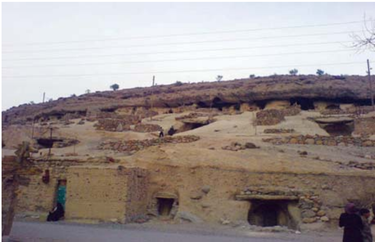
میمند، کرمان