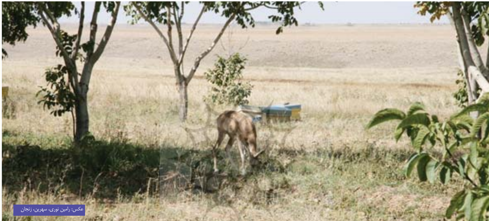
عکس: رامین نوری، سپهرین، زنجان